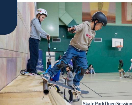
Skate Park Open Session

Véritable Levallois Street Club, la section Nouveaux Sports propose, avec ses modules dédiés, de se former aux nouvelles disciplines olympiques, ainsi qu'aux dernières tendances sportives en milieu urbain.